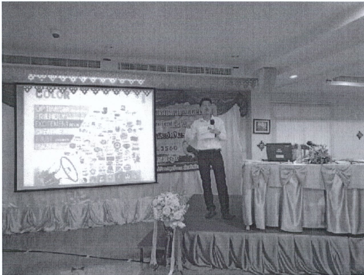
ภาพกิจกรรมการฝึกอบรม โครงการการผลิตสื่อประชาสัมพันธ์อย่างง่ายเพื่อการประชาสัมพันธ์งานด้านปศุสัตว์