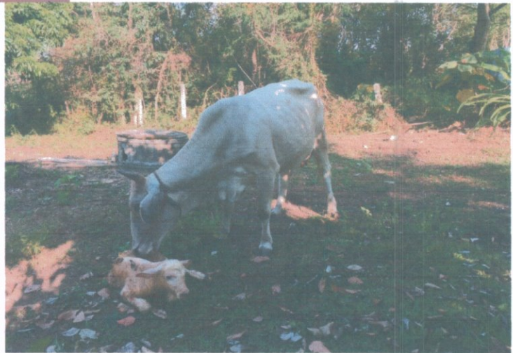
ลูกที่เกิดการเหนียวการเป็นสัตว์ (จากการวางฮอร์โมน)และผสมเทียม