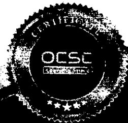
(นายปียวัฒน์ ศิวรักษ์) เลขาธิการคณะกรรมการข้าราชการพลเรือน

(รวมระยะเวลาทั้งสิ้น 4 ชั่วโมง) ให้ไว้ ณ วันที่ 9 มีนาคม พ.ศ. 2566