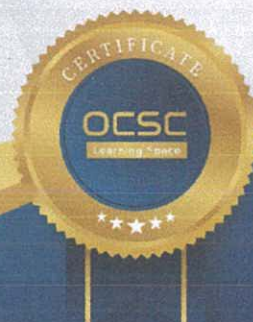
(นายปิยวัฒน์ ศิวรักษ์) เลขาธิการคณะกรรมการข้าราชการพลเรือน

[รวมระยะเวลาทั้งสิ้น 3 ชั่วโมง] ให้ไว้ ณ วันที่ 9 มีนาคม พ.ศ. 2566